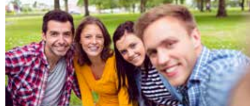
Laat je stem horen als jongere! p. 3