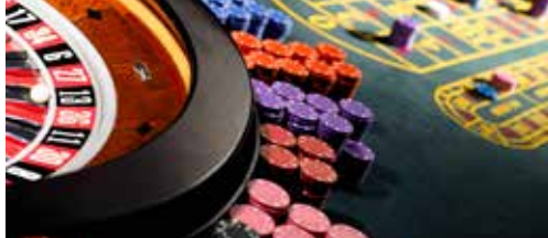
'Gratis' casino kost Middelkerke miljoenen p. 2